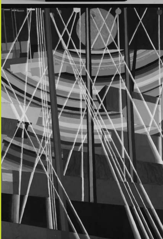
Sascha Wiederhold: Kikötő (részlet)