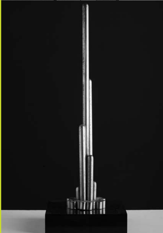
Beöthy István: Aranyos, 1949